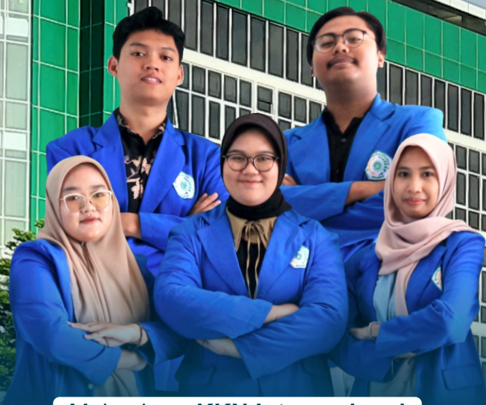
Mahasiswa KKN Internasional